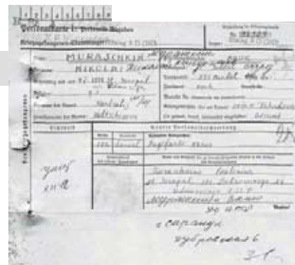
Карточка военнопленного шталага XD-310

ЦАМО РФ, ф. 58, оп. 977321, г. 1701, л. 8.